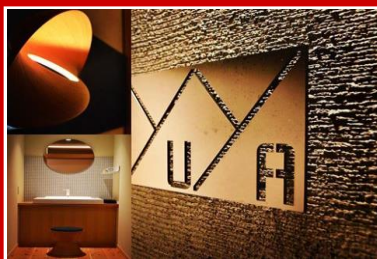
YUYA / villadiyubara ☎0867-62-2111